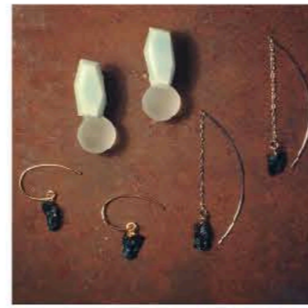
小川文子(ayako.ceramics) 陶芸作家 京都在住