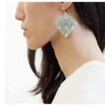
北美貴(Jul) プロダクトデザイナー 金沢在住