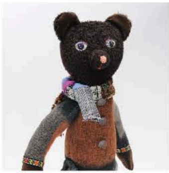
入江優子(IRIIRI) にんぎょう作家 大阪在住