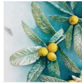
十川賀菜子(BELLEZZA) ガラス作家 大阪在住