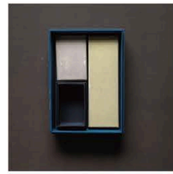
ハタノワタル 黒谷和紙漉き師 京都在住